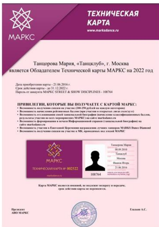
Вид электронной карты с фото

6. Руководитель может загрузить фото танцора, скачать Электронную карту