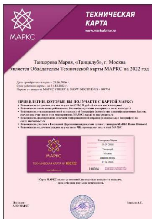
Вид электронной карты без фото